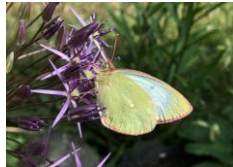
Svavelgul höfjäril

8/6 ORSA Skåda dagfjärilar med Felix Fotling på lämplig äng, samåkning från Willys parkering kl. 14! Kontaktperson: Roland Öjeskog, 070-245 53 75