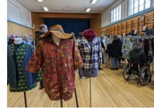
Från klädbyttardagen i Mora

I lördags (27/4) var det nationella Klädbyttardagen och i Mora måste det ha varit en riktig folkfest, 197 personer, varav 35 män, bytte 1183 plagg på två timmar. Morakretsen och Mora Folkhögskola måste ha haft det roligt och svettigt på samma gång. 😊 Även i Falun, Orsa och Smedjebacken (Västerbergslagenkretsen) anordnades det klädbyten liksom i Bollnäs och Dellenbygden. Därtill var det prylbyttardag i Gävle helgen innan. Härligt!