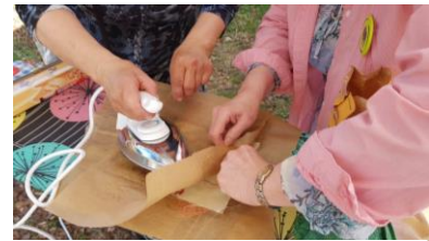
Från fjolårets mässa

Besök Studieförbundet och Naturskyddsföreningens monter om Rädda bina och projekt Mångfaldens Trädgård. Gör din egen biduk bl.a. https://www.tradgardochhantverk.se/