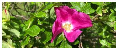
Vresros