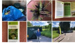
Kollage från tidigare lupinbekämpning

14–17/6 SANDVIKEN Lupinbekämpning för fjärde året i rad. Mer information kommer på kretsens hemsida.