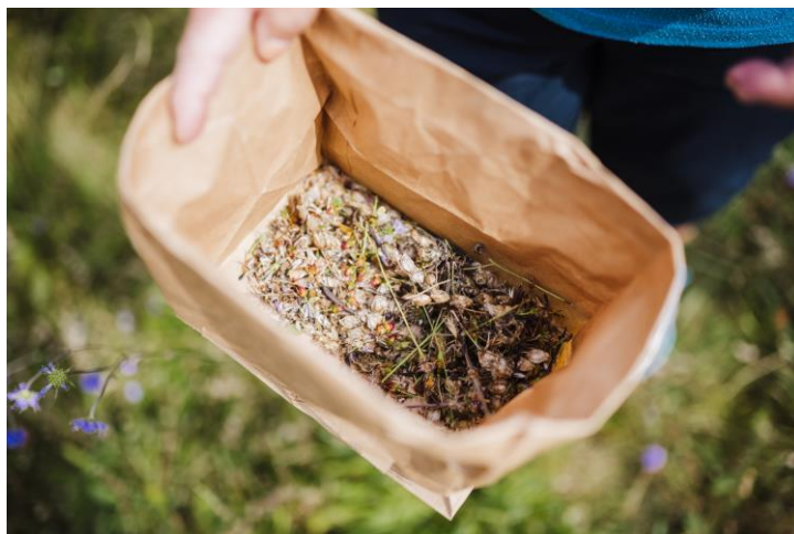
Insamling av vilda fröer i Halmstad