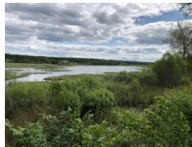
Vy över Bysjön i majskrud

4/5 GÄVLE Diskutera med oss, vi har bord vid samråd Nyhamn. Öppet för allmänheten kl. 12-15!