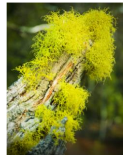
Varglav