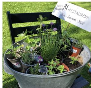
Bilden togs under Nationaldagsfirandet i Gävle då Folk i rörelse för ett hållbart Gävle anordnade en mängd olika aktiviteter med hållbarhetstema

Arrangemanget genomförs i samverkan med Folk i rörelse för ett hållbart Gävle, vilka arrangerar cykelcruising, potatisupprop m.m. i samband med Å-draget den 7 september.