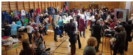
Klädbytdag i Mora 2022

OBS! 22 april är det officiella datumet för Klädbytdagen, men det går såklart att hålla i den en annan dag om det passar bättre.