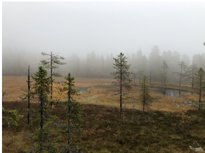
Vacker myrmark i Orsa Finnmark

Skogsgruppen Gävleborg har också varit flitiga under det gångna året, under våren genomfördes utbildningssatsningen "Upptäck gammelskogen i Gävleborg" tillsammans med Skydda skogen och Studieförbundet, vilken bestod av två digitala utbildningsträffar och två skogsdagar i fält. I slutet av september var det därtill inventeringshelg i Orsa Finnmark, vilket lockade deltagare från både Dalarna och Gävleborg.