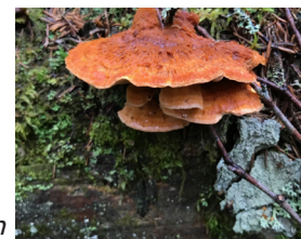
Brandticka