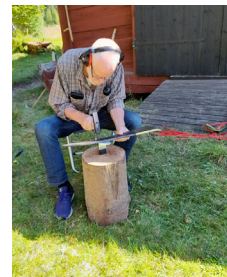
Lieknackning, foto: Christina Åström

Flera av deltagarna hade slagit med en vanlig lie förut och det märktes att det fanns viss rutin att svinga lien, vilket inte skiljer sig åt från att slå med en traditionell lie. Det som är annorlunda är sättet att hålla den vass. Och oj så vass! Man behöver inte släppa med sig en slipsten som är nog så tung och inte helt lätt att hantera på rätt sätt. I stället knackar man ut eggen på liebladet över ett litet städ. Det är inte så stort och tungt utan är fullt möjligt att ta med sig till olika platser. Det krävs dock även här träning för att tekniken att få det riktigt vasst ska sitta. Stålet i själva lien har en annan kvalitet än i den typ av lie vi traditionellt använt i Sverige. Det går inte att knacka eggen på en sådan lie vass. Den måste slipas.