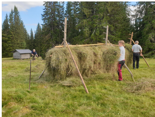
Slätter i Orsa, foto: Peter Turander

Riksföreningens projekt "Världens längsta blomsteräng" lanserades under året och tre kretsar från regionen agerade som pilotkretsar, identifierade lämpliga vägkanter, såg till att de inte slogs för tidigt, letade främmande växtarter och eventuellt tog bort sådana samt satte upp informationsskyltar. Det var Avesta, Gävle och Västerbergslagen som gjorde denna fina insats. Inför kommande år är det meningen att alla kretsar som vill ska kunna haka på. Här får således alla andra kretsar i regionen en vänskaplig uppmuntrande puff att i år adoptera en vägkant eller två.