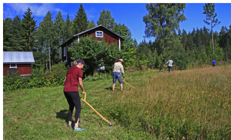
Slätter