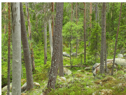
Gammeltallskog vid Stapeltjärn i Orsa

När det gäller skog är de ideella insatserna imponerande och otaliga, vilket är tur då läget i den svenska skogen är akut. Stjärnsunds skogsgrupp har inventerat mängder av knärotsskogar inom Dalarnas län och framförallt Hedemora kommun med omnejd. Skogsgruppen har hjälpt Dalarnas länsförbund att överklaga en mängd dispensärenden där länsstyrelsen beviljat undantag från artskyddsförordningen för att knärotsskogar ska kunna avverkas. Stjärnsunds skogsgrupp fick också Dalarnas miljöpris 2022 för sina ovärderliga insatser. Orsas skogsgrupp har i sin tur gjort en enorm inventeringssatsning under 2021–2022, vilken mynnade ut i en fantastisk rapport med titeln "De sista skyddsvärda naturskogarna i Orsa". Rapporten går fortfarande att ladda ned via länsförbundets och Orsakretsens hemsida.