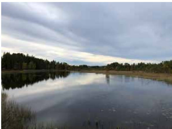
Vårt livgivande vatten.

Välkommen till en heldag där vi lär oss mer om de vatten som omger oss och låter oss inspireras genom att ta del av goda exempel samtidigt som vi får veta hur berörda myndigheter jobbar.