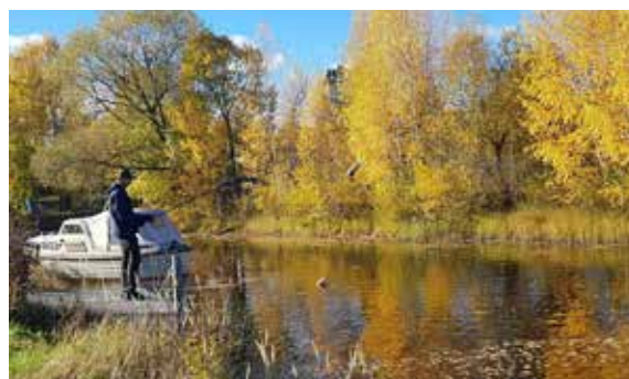
Fiske vid höstfagra Siljan.

I övningen "Vem har rätt till skogen?" gick diskussionens vågor höga medan skratten ekade under de många skojiga lekarna som hjälpte till att hålla värmen uppe.