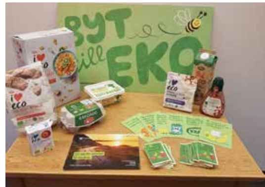
Byt till ekofrukost!

- När maten blir dyrare är det tufft för ekobönderna. Det är viktigt att stötta ekologiskt när man kan. Att komplettera med egenplockade bär och frukter och baka själv på ekologiskt mjöl kan spara pengar under tuffa tider.