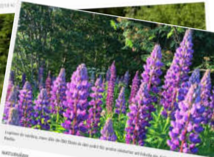
Lupiner är svåra att slå ut i trädgården. Här är några tips på hur du kan bli av med dem.

Pina en lupin – lupiner i Bräcke ska brännas upp