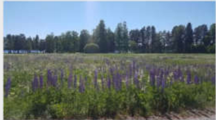
Lupiner växer ofta vid vägkanter.