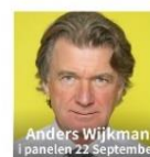
Anders Wijkman i panelen 22 September