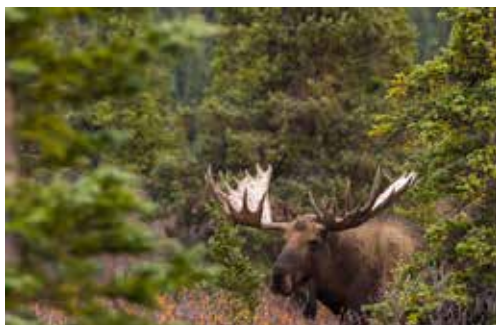
Älgtjur i Denali nationalpark, Alaska.

18/2 HOFORS-TORSÅKER Storälgar i Alaska. Björkhagsskolan kl. 19.00 Stig Björk visar bilder och berättar om sin resa till nationalparken Denali. Vi bjuder på fika, men kom ihåg att ta med egen mugg!