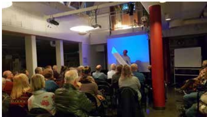
Arne visade upp EU:s lista över kritiska metaller som bara blir längre och längre.

Det finns många problem med gruvnäringen som att endast små mängder kan utvinnas, barnarbete och usla arbetsförhållanden, utvinning i ökenområden med hjälp av vatten och nästan ingen återvinning. Det finns också planer på att utvinna metaller ur djuphaven, men forskarna är mycket skeptiska.