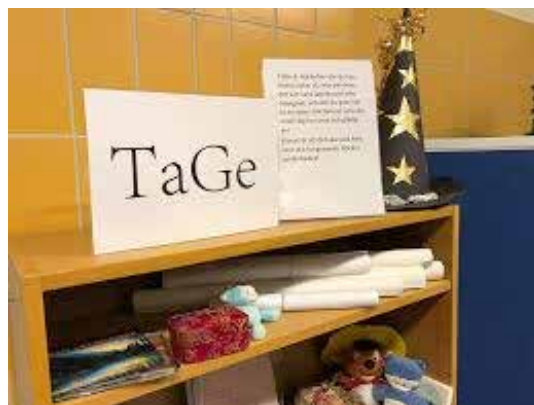
Exempel på delningsekonomi, en TaGe-hylla.

Det är enkelt, roligt och bra för miljö och plånbok!