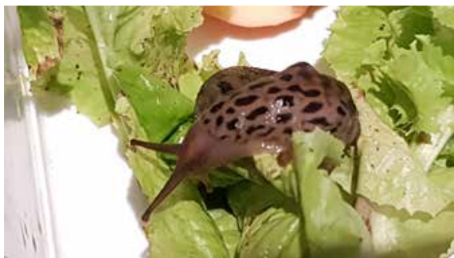
Leopardsnigel, inte att förväxla med mördarsnigel

Arr. Folkuniversitetet, Naturum och Naturskyddsforeningen Dalarna.