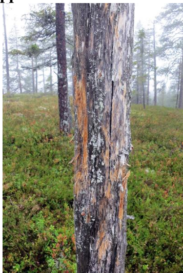
Björnunge som lekt med klorna?