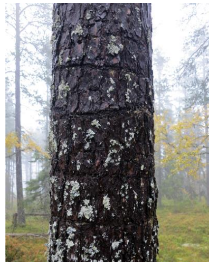
Savhack tretåig hackspett (ringarna)

(Forts. Björnsjöknopparna) Solitär gran på väl-dränerad relativt näringsfattig mark, här i för dagen låg molnbas, dimma och regnskurar. Granen vacker, tungt och ymnigt behängd med lav.