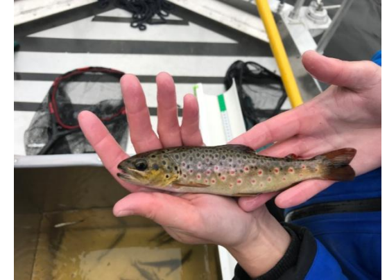
Elfiskad vild öring från Bollnäsströmmarna, Ljusnan, ett område där nu flera förbättringsåtgärder för livet i vattnet har vidtagits.