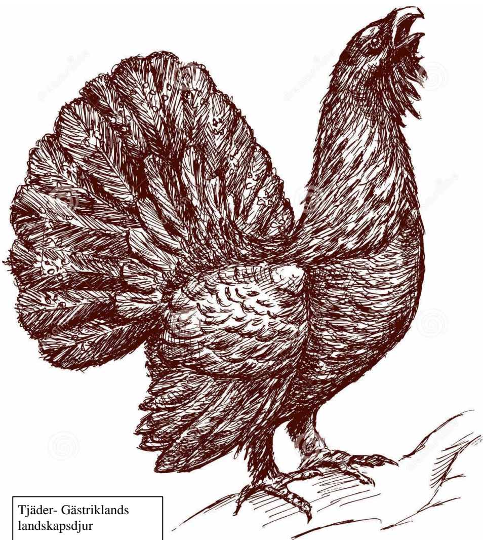
Tjäder- Gästriklands landskapsdjur