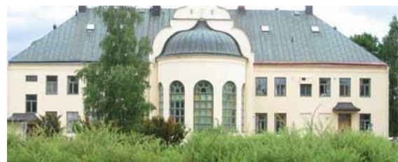
Kansli Gävle-Dala finns i Tingshuset i Mora.

Efter årsskiftet får Naturskyddsföreningen 10 regionala kanslier.