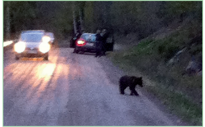
Stanna inte och gå aldrig ut ur bilen om du ser en björn vid vägen. Det kan leda till att björnen förlorar respekten för människor. Bilden visar en ung björn i Galven i Hälsingland i maj 2014.

Björnar har ett väl utvecklat luktsinne och lockas av allting som luktar. Om en björn kommer åt exempelvis ensilage, havre, fågelmat, sopor eller fallfrukt är risken stor att björnen kommer att vara kvar i området så länge maten finns kvar.