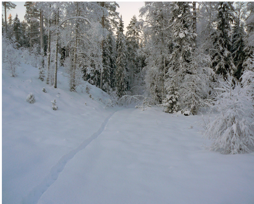
Spårlopa genom Amungenreviret. Okänt antal individer.

En tredje grupp spårade av skogsvägarna öster om Svabensverk, ringade ett stort område där man funnit vargarnas ”in-spår” in i området. Här fanns tecken på att vargarna bedrivit jakt på älg och då spårarna efter lång tids letade längs vägkanterna inte fann några ”ut-spår” från det ringade området, lämnade de området för att inte störa vargarna. Av spåren att döma var sannolikheten stor att vargarna nu befann sig i det ringade området, troligen tillsammans med en slagen älg.