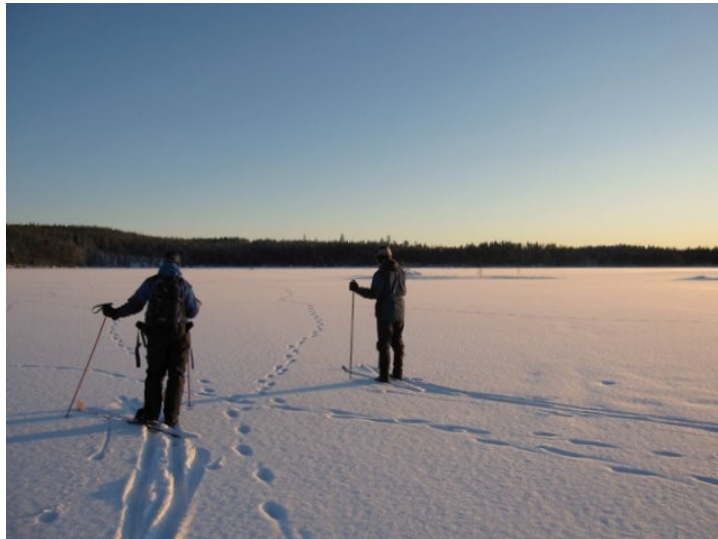
Flertalet spårlöpor på sjön Bresiljorna

Dagens spårningar tillsammans med Leif och Rolands spårningar några dagar tidigare, tyder på 5-6 individer i Ockelboreviret.