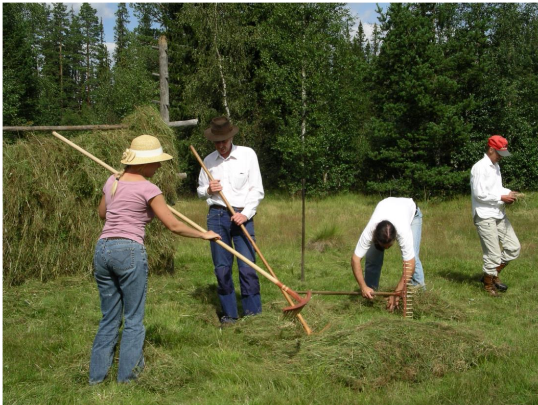
Slätterkurs vid Fulufjället

Lördag 11 feb kl 10-15, Björkhagsskolan i Hofors