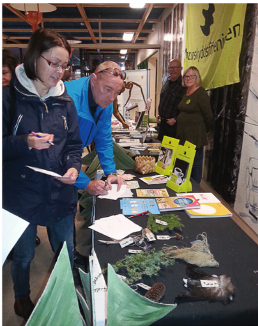
Kretsen i Vansbro hade fin info i foajén till musikalen Blodigt allvar.