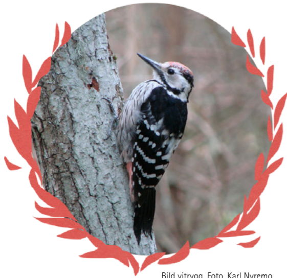
Bild vitrygg.